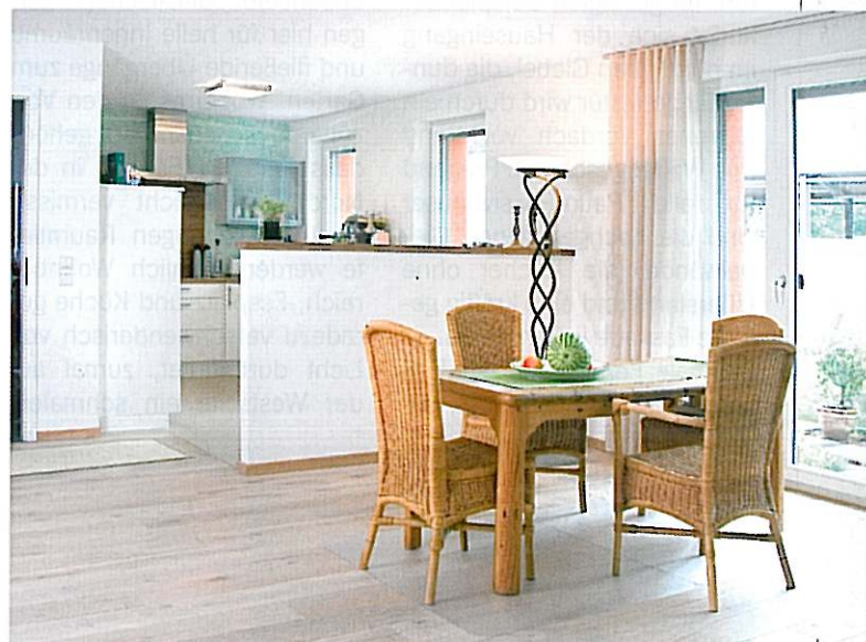
Ein offener Grundriss und bodentiefe Fenster sorgen für viel Platz und Licht im Wohnbereich.

Ben Grundstücke gerückt, ein Gerätehaus und eine Garage fungieren nicht nur als praktische Lager- und Parkmöglichkeit, sie dienen auch als Sichtschutz zur Straße hin. So entsteht der 94 Quadratmeter große Innenhof, der dem Haus