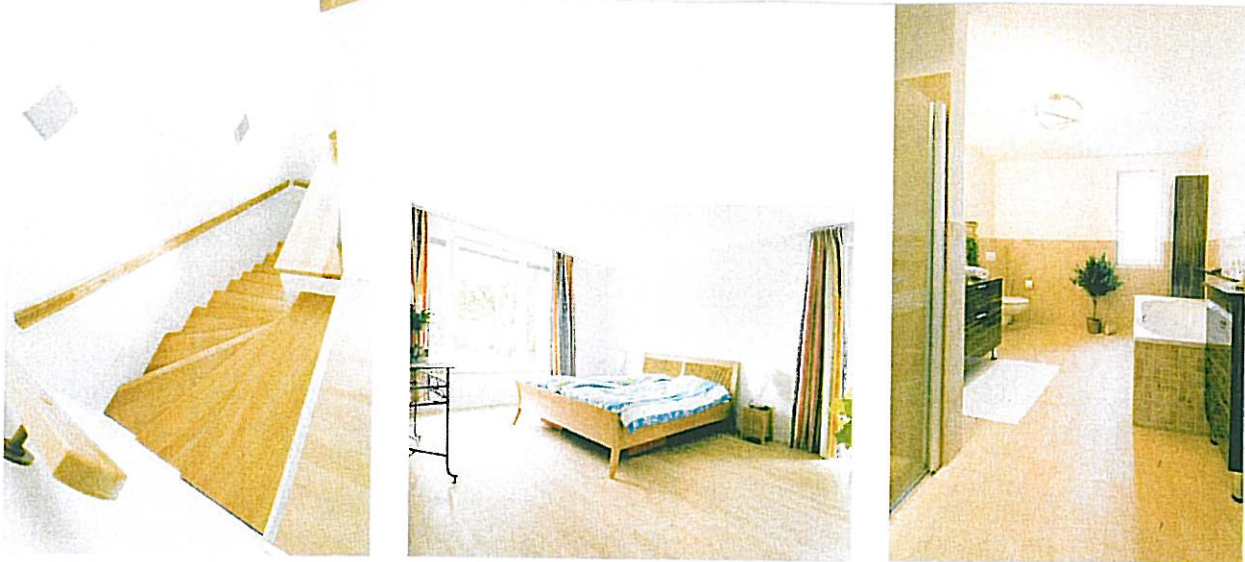
Durch die Zweigeschossigkeit können die Flächen im Dachgeschoss voll genutzt werden.

Garten, in dem die Bewohner ganz für sich sind. Weil es bei der Planung und Erschließung individuelle Spielräume gab, gleicht kein Haus dem anderen. Im gezeigten Beispiel befindet sich der Hauseingang im nördlichen Giebel, die dunkle Eingangstür wird durch ein filigranes Vordach vor Wind und Wetter geschützt. Prägend für alle Patio-Passivhäuser sind die hochgezogenen Giebelwände, die Dächer ohne Überstand und eine kräftig getönte Fassade in Terracotta. Schmale Fenster auf der Eingangsseite spenden Licht, oh-