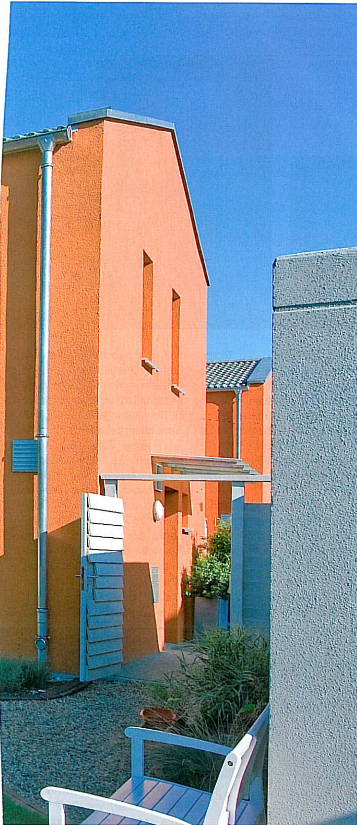
Ein einfacher Baukörper – aber dank Farbe und abwechslungsreicher Fensterfronten trotzdem nicht langweilig.

In Hannover Seelhorst wurde diese Aufgabe mit routinierter Professionalität gelöst. Die Häuser, als lang gestreckte Rechtecke von 14,86 x 6,72 m ausgeführt, wurden an die nördliche Grenze der knapp 300 Quadratmeter gro-