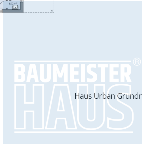
Haus Urban Grundriss