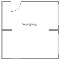
Haus Urban Grundriss